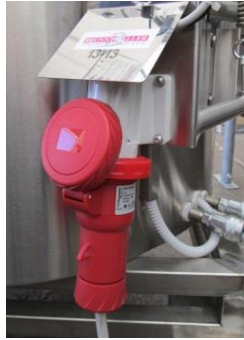
Подключение к электросети