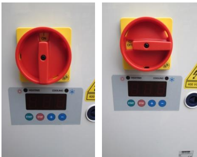
Пуск оборудования: ON/OFF